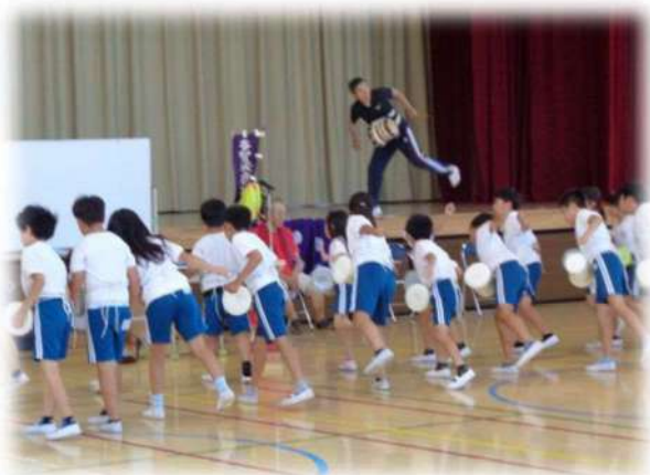
八幡小 “鹿踊り”学習