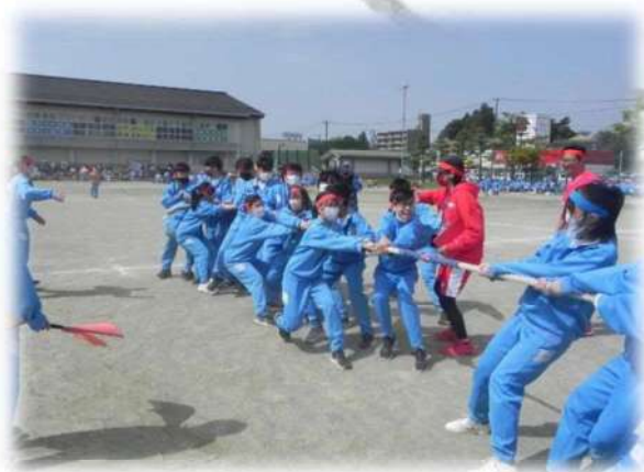
県下一早い体育祭の様子