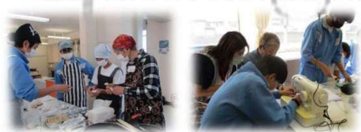
地域ボランティアの協力による 1年生調理実習と 2年生のミシン実習の様子

地域の方々と一緒に活動することで、中学生の活動意欲が向上したり、自己有用感を感じたりするなど、充実感を得ることにつながっています。