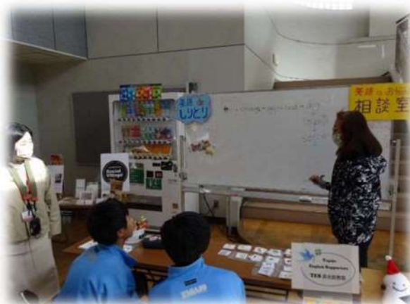
地域と多賀城中の合同催し