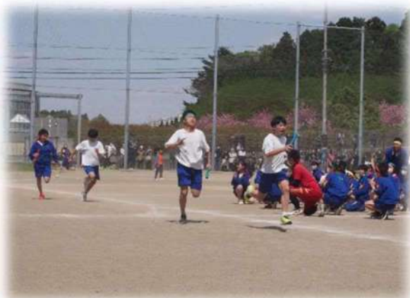
高崎中体育祭の様子