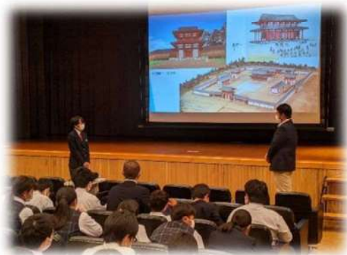
1年生の地域学習の様子