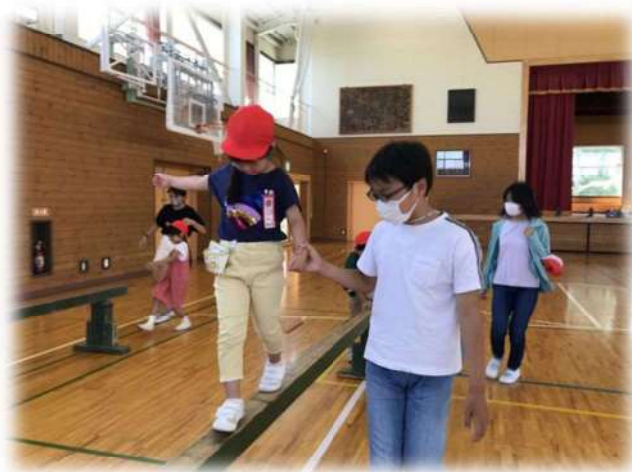
“青葉交流会”の様子