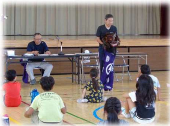
“多賀城鹿踊り” 学習の様子