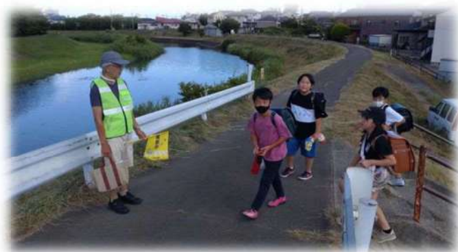
通学路の見守り活動の様子