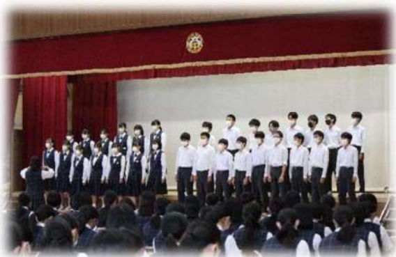
合唱コンクールの様子

地域の方々とふれあいながら、職業体験をすることで、地域の諸産業の実態を学ぶとともに、望ましい職業観・勤労観の育成につながっています。