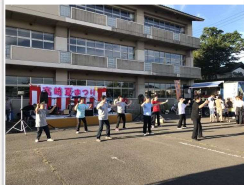
太極拳もしていました

以前は高崎中学校にて盛大に夏祭りを開催していました。 令和5年の夏祭りは高崎集会所で出来る範囲での夏祭りを開催しました。