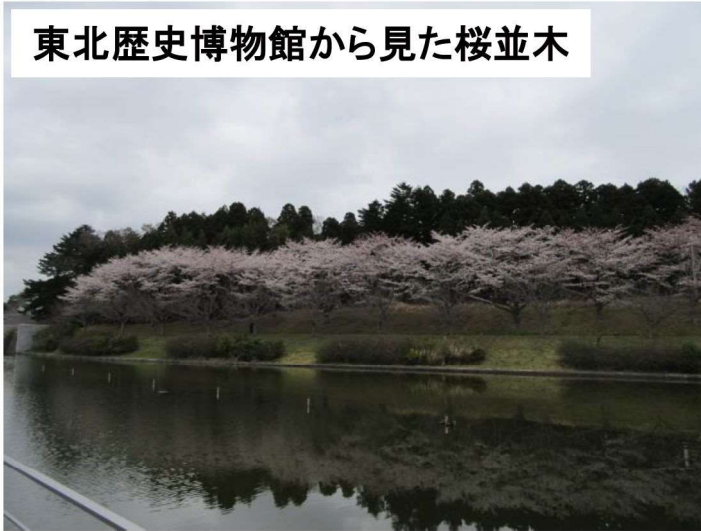
東北歴史博物館から見た桜並木

「災害時は自分の身は自分で守る。」という意識がある住民が多いです。行政に頼らずに対応していくところや知恵は高崎の強みです。