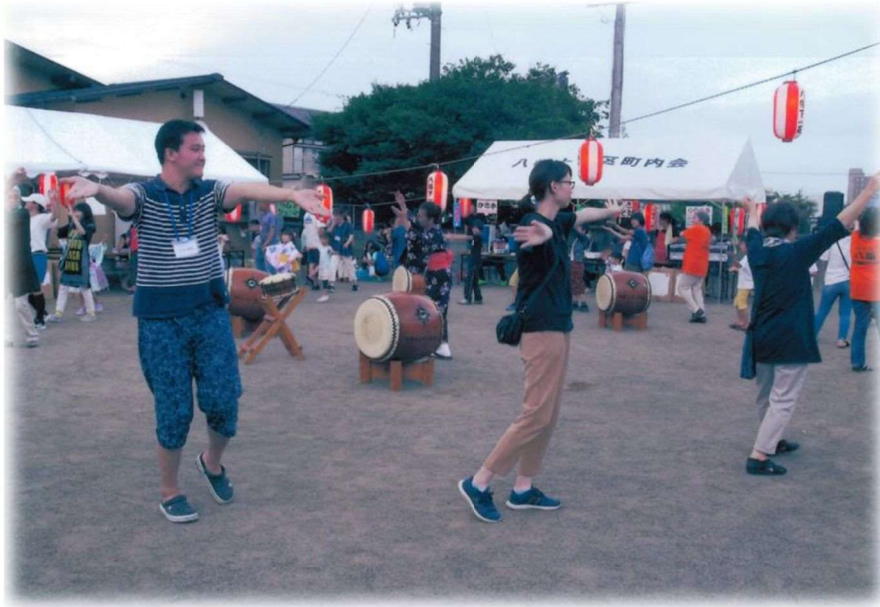
八幡地区 『上一・下一合同夏祭りの様子』