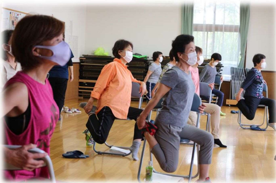
留ヶ谷地区 『育自の会の活動様子』