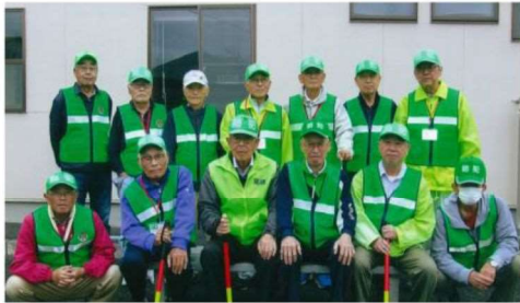
高崎地区防犯協会の皆さん