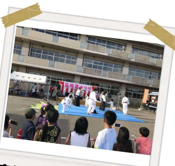
高崎中学校を会場に開催

キャンパスが移転した現在、高崎地区では子供夏祭りを含め、世代間の交流をどのように進めるか検討しているところです。