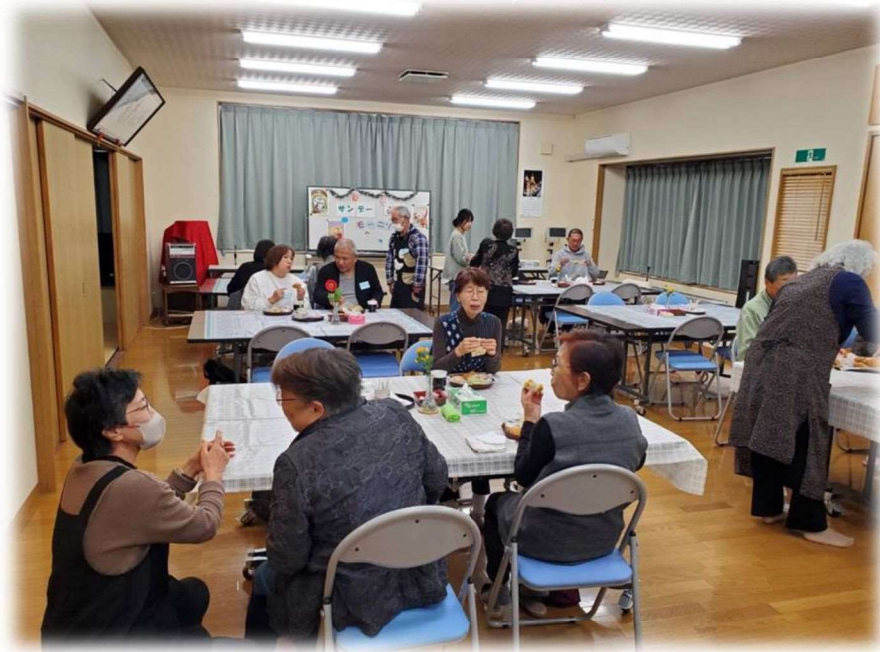
東田中地区 『モーニングカフェの様子』