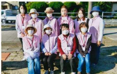
高崎交通安全母の会の皆さん