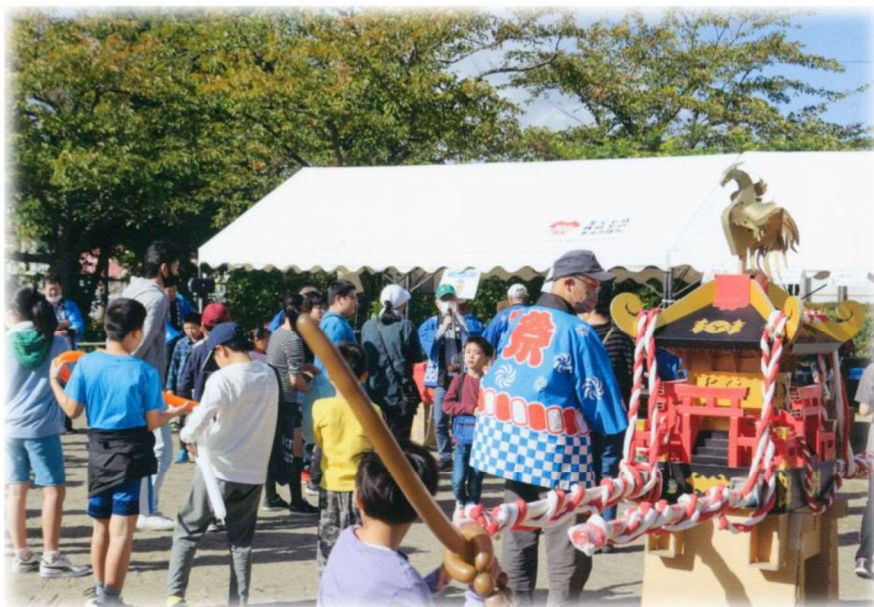
志引地区 『秋祭りの様子』